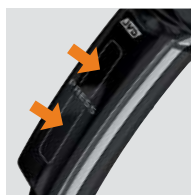
SYSTÈME DE POIGNÉE INTERRUPTEUR BREVETÉ