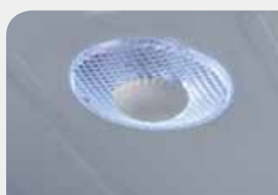
Εσωτερικός φωτισμός LED με διακόπτη on / off