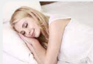
Χωρίς κραδασμούς και χωρίς θόρυβο